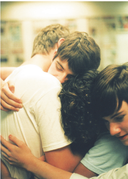
Arregla Disciplina Escolar Mini Herramienta

Un estudio profundo encontró que estudiantes que reciben instrucción SEL tenían más actitudes positivas acerca de la escuela y mejoraron con un promedio de 11 puntos de porcentaje en exámenes de logro estandarizado comparado con estudiantes quienes no recibieron tal instrucción. 3